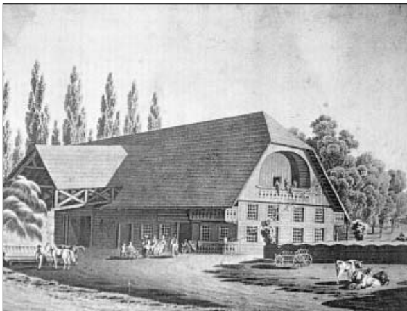
Brunnmattgut in Niederwischtrach, 292x203mm, um 1830