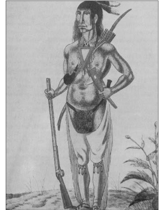
Häuptling Peguis, 102x152 mm, 1821