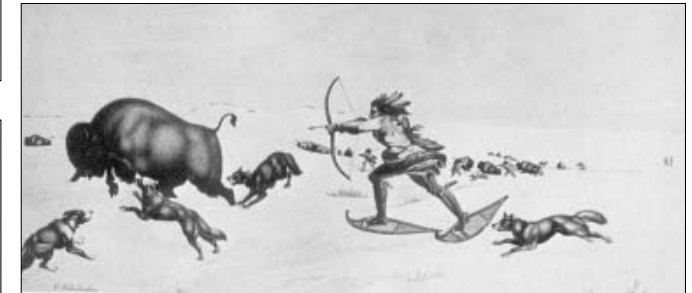
Bisonjagd, 394x228 mm, 1821