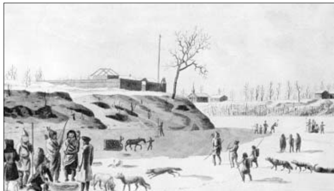
Eisfischen am vereisten Red River, 305x190 mm, 1821