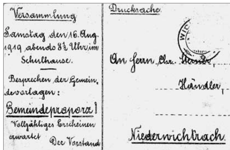
Einladung zu einer Parteiversammlung der Bauern-, Gewerbe- und Bürgerpartei.