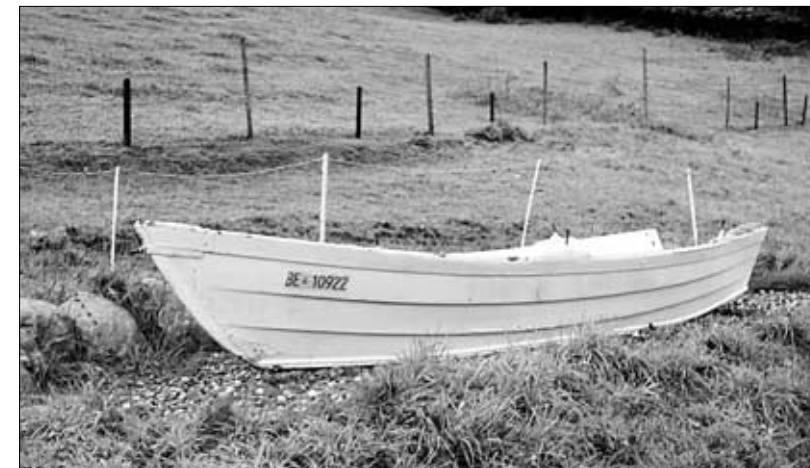
Die fantasievoll gestaltete Umgebung lädt zum Spielen und Verweilen ein.

Bereits konnten etliche Schul- und KUW-Klassen sowie Behindertengruppen den SpielRaumHof kennenlernen. Von kurzen