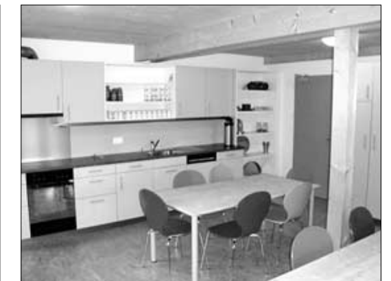
Der Wohnraum ist in fröhlichen Farben gestaltet.