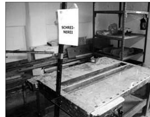
Gebrauchsfertig eingerichtete Werkräume im ehemaligen Kuhstall.