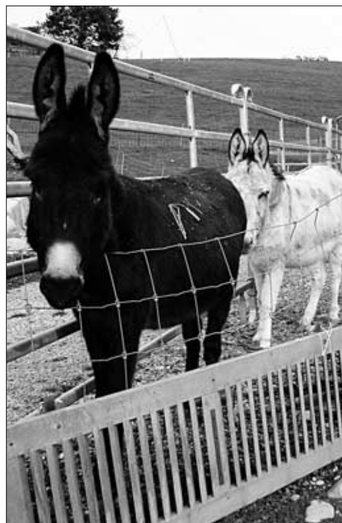
Die zutraulichen Tiere mögen menschliche Gesellschaft.