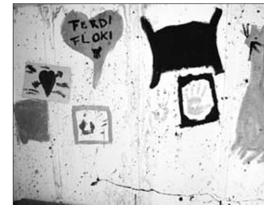
Im Spielhaus haben bereits mehrere Besucher ihre Visitenkarte hinterlassen.